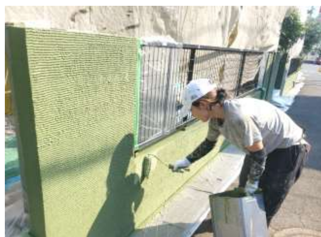
中塗り・上塗り／完了