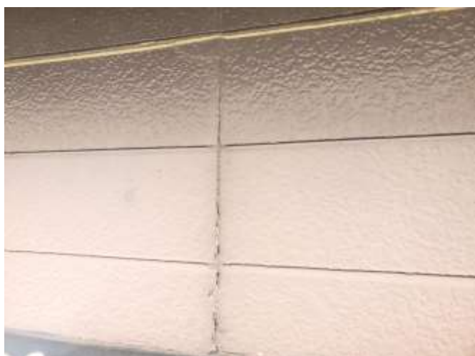
高圧洗浄後 施工前