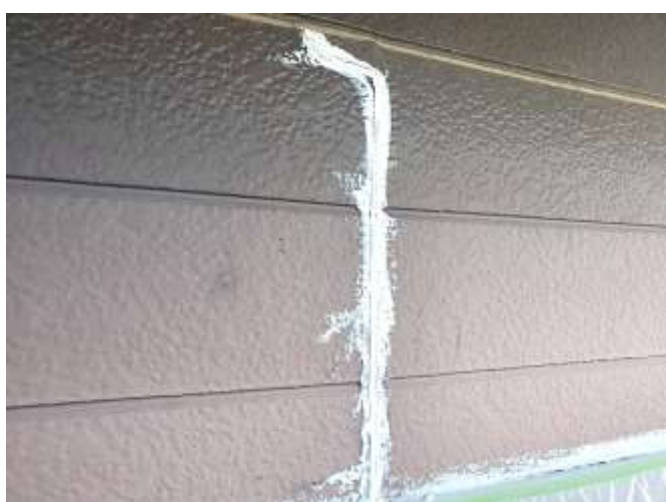
下地処理 樹脂モルタル補修