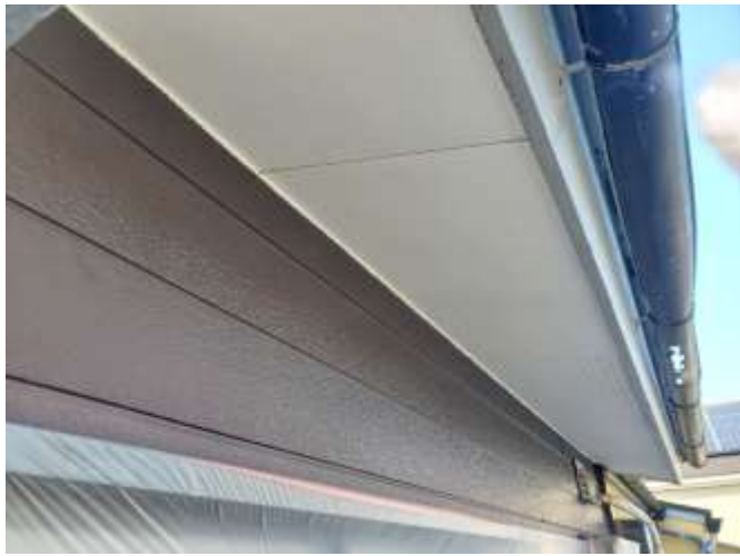
高圧洗浄後 施工前