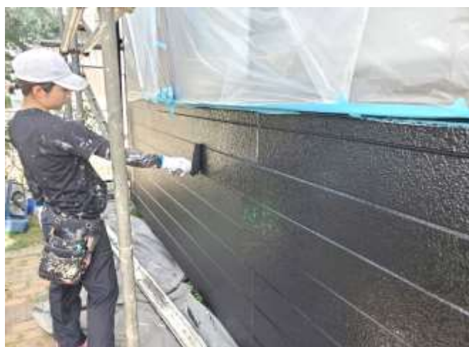
中塗り・上塗り／完了