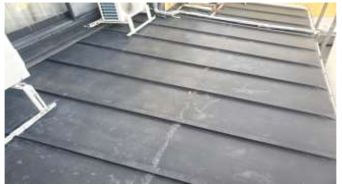
高圧洗浄後 施工前