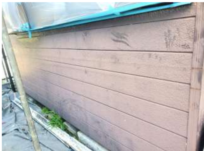
高压洗浄後 施工前