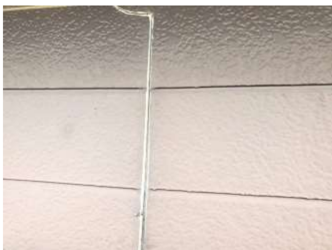
下地処理 シール撤去