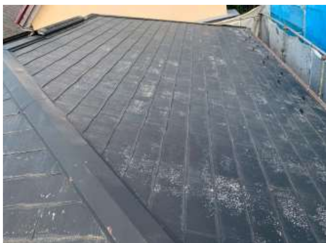
高圧洗浄後 施工前