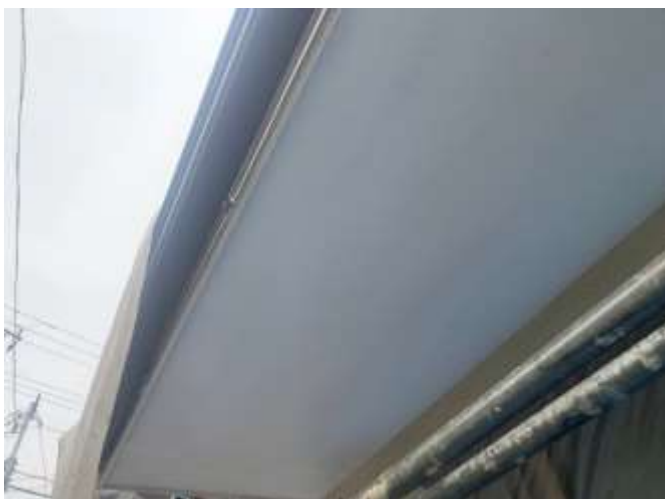
高压洗净後 施工前