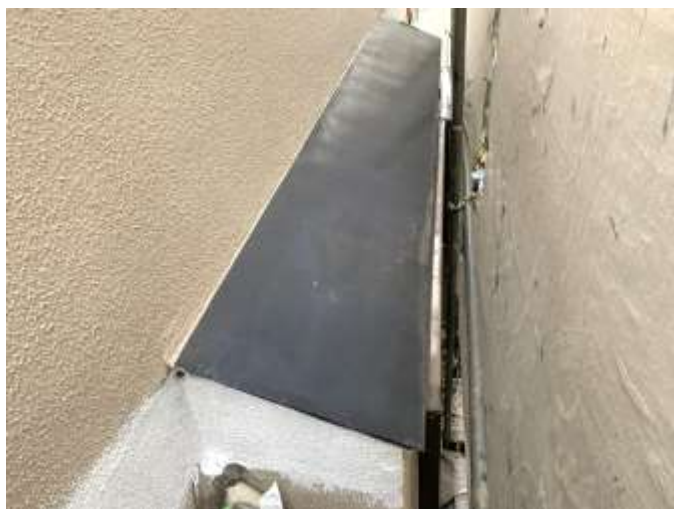
霧除け／高圧洗浄後 施工前