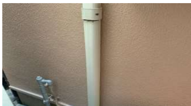
室外機ホースカバー／施工前