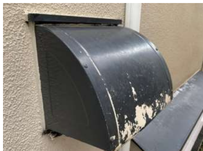
高圧洗浄後 施工前