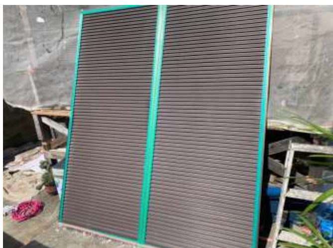
高圧洗浄後 施工前