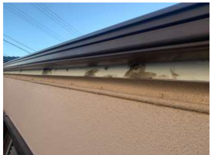
高压洗净後 下地処理