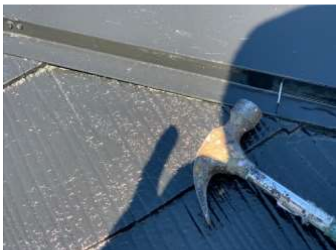
下地処理 釘打ち増し前