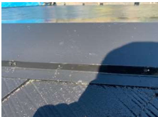
下地処理 釘打ち増し完了