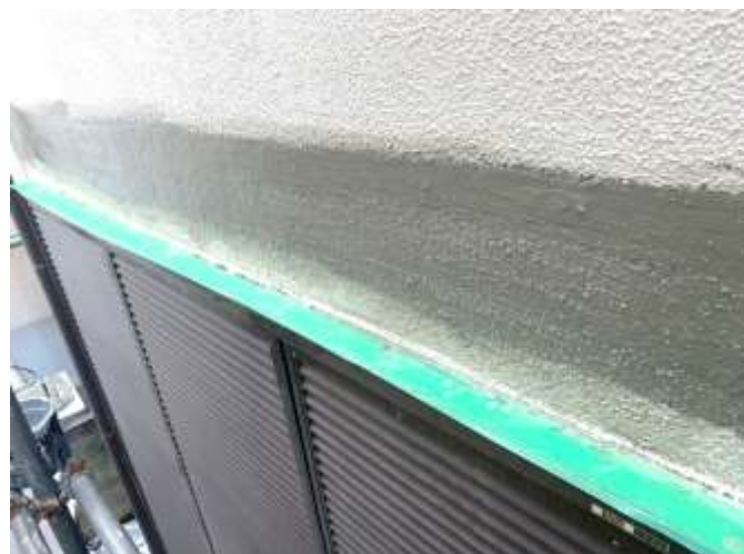
樹脂モルタル補修