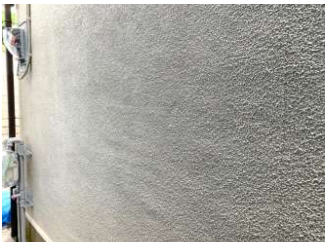
高圧洗浄後 施工前