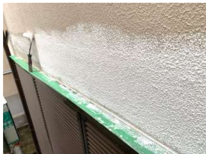
下塗り(パターン付け)