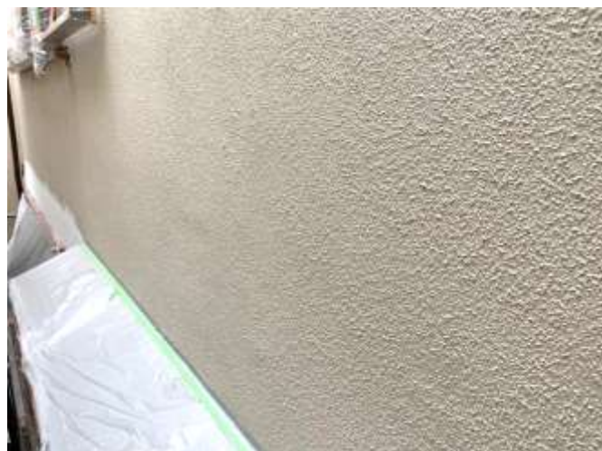
高圧洗浄後 施工前