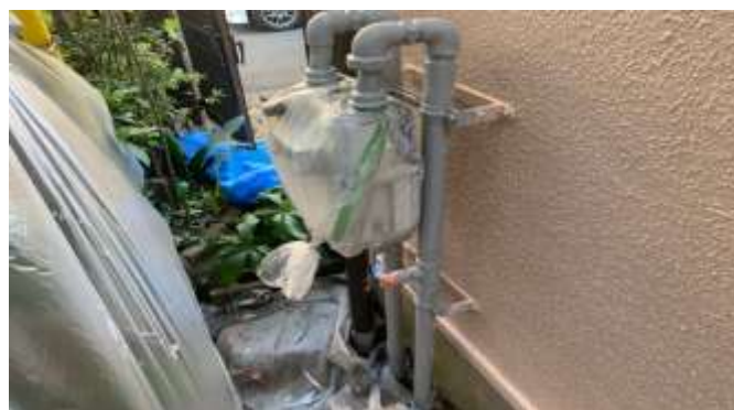
ガスメーター／錆止め