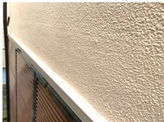
中塗り・上塗り／完了